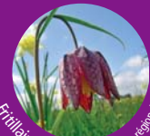
Fritillaire pintade - Protection régionale