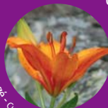
Lis orange - Cueillette interdite